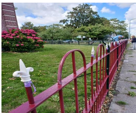
Het gespoten en geschilderd hek.