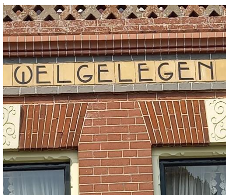
Welgelegen voorzien van nieuwe laag verf.