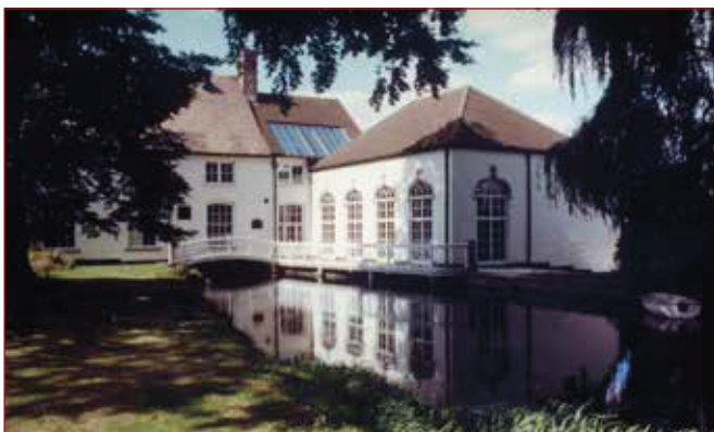
Het Hamilton Kerr Institute bij Cambridge.

Het Hamilton Kerr Institute lag even buiten de universiteitsstad en was gevestigd in prachtige gebouwen rondom een voormalige molen. 'Ik werkte daar in een klein laboratorium vlak bij de grote zalen van het instituut, waar je uitkeek over de tuin die in de lente vol stond met bloeiende narcissen.'