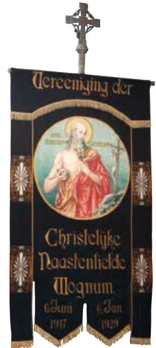
Vaandel van de Christelijke Naastenliefde Wognum.

In een vrijdagavond gehouden vergadering van R.K. land- en tuinbouwers en veehouders, uitgeschreven door het Bestuur der L.T.B.- afd. Wognum, werd besloten tot oprichting eener vereniging Werkdadige Naastenliefde nadat doel en werking door het bestuur waren uiteengezet.