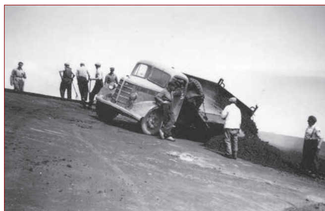
Het asfalt wordt gestort.