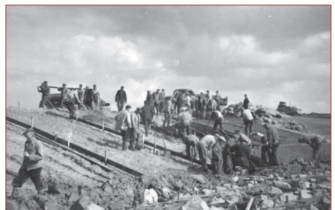
Met man en macht wordt er gewerkt aan het dijkerstel.