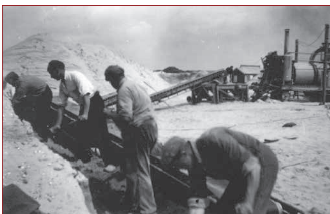
Het zand voor de asfaltinstallatie wordt op de lopende band geschept.