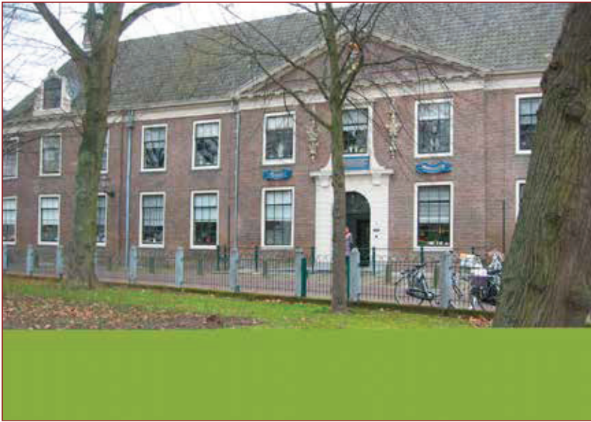
Het huidige St. Pietershof aan het Dal in Hoorn.

gesloopt, kregen de gebouwen daarop een wereldlijke bestemming. De kerk van het St. Pietershof richtte men als Pesthuis in, waar de lijders aan deze ziekte werden geïsoleerd. In 1692 is het gebouw gesloopt om plaats te maken voor de brede ingangsvleugel van het tegenwoordige gebouw aan het Dal. Het klooster kreeg in 1585 de bestemming van Oude Mannenhuis. Voor een bepaald bedrag, dat afhankelijk was van de leeftijd en soms ook van de lichamelijke konditie of van geldelijk vermogen, kon men zich inkopen. De proveniers of kostkopers kregen voor hun ingebracht kapitaal behalve onderdak recht op enkele maaltijden per dag: de preuve of schaffing. In 1617 is het complex aanmerkelijk uitgebreid door de bouw van het zogenaamde Vierkant in de noord-westelijke hoek aan de Baanstraat. Dit afgescheiden gedeelte ging dienst doen als dol- en tuchthuis, dat wil zeggen dat er op last van schepenen zowel gevangenen als krankzinnigen konden worden opgesloten. In 1700 is het Vierkant zwaar door brand geteisterd. Na herbouw is het in 1814 als Huis van Arrest ingericht.