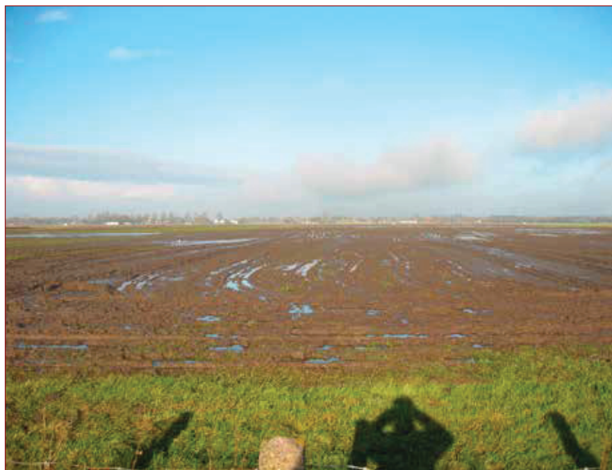
De Lazarusweide, winter 2015. Het perceel is nu zonder sloot of hek verbonden met naastgelegen percelen. Halverwege ligt nu een brede sloot parallel aan de wegen noord en zuid.

Dit is nog over de huur van 1672, want in 1673 lukt het niet om het land als geheel te verhuren. Wel wordt