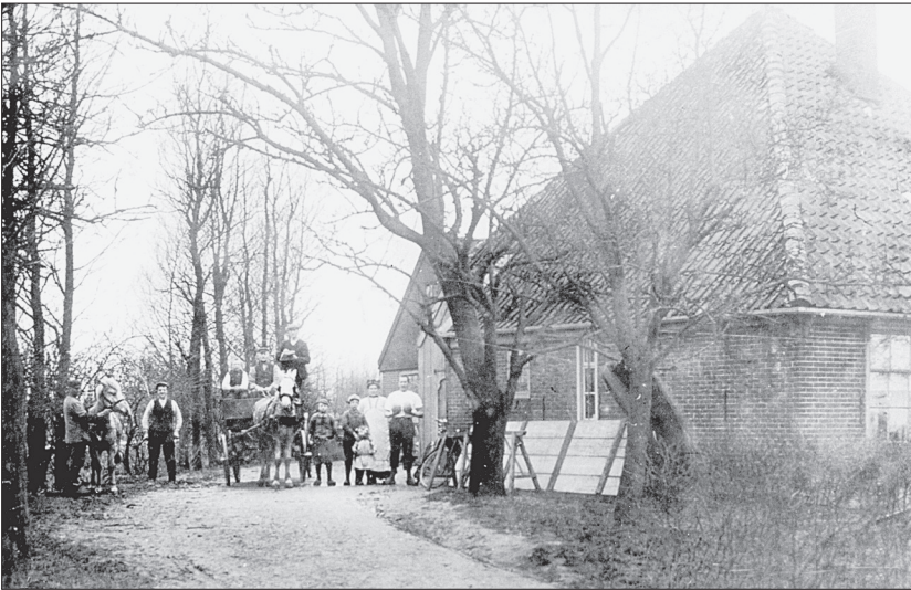
Foto 1913 Ganker. Kaas- en melkfabriek 'De Onderneming' in 1897 opgericht, destijds op de hoek Ganker en Het Woud.

Iets verder, op de kruising van de Lange Ganker en Het Woud (nu mevrouw Ettes op nr. 25) stond de melkfabriek van Nibbixwoud, tevens kaasfabriek 'De Onderneming'.