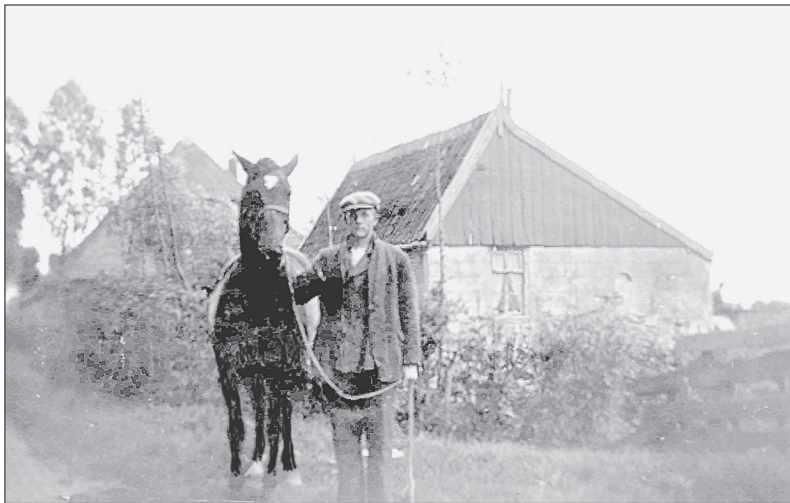
Het huisje Nibbixwoud no.2.

We moeten ons echter niet veel van zo'n cafeetje voorstellen. Veel meer dan een tafel met wat stoelen in een klein vertrekje achter de woonkamer was het niet. In het achtereind stond een bak waar het water inliep vanuit de dakgoot. Hierin hing een kruik met jenever om de drank koel te bewaren. Als de kurk open was geweest en de borrel slapper was geworden, zei men: 'Je hebt de borrel zeker gewassen, Jantje' . Waarschijnlijk had ze de jenever dan verdund met wat water om zodoende meer borrels te kunnen verkopen.