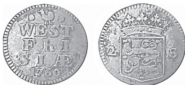
Dubbele stuiver West Friesland 1760