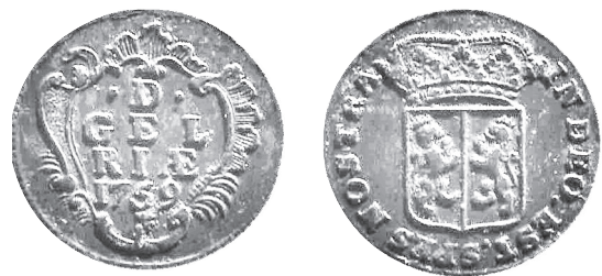
Duit Gelderland 1759