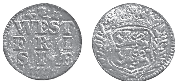
Westfriese duit: WEST FRISIAE 1716