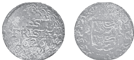
Westfriese duit: WEST FRISIAE 1626

Om tenslotte nog eventjes wat dichterbij huis te blijven iets meer over de muntslag in West-Friesland. Deze is begonnen in 1586 te Hoorn. Dat er binnen het gewest Holland sprake kon zijn van een zelfstandige muntproductie zegt iets over de onafhankelijke opstelling van de spreekwoordelijk 'stijfkoppige' West-Friezen, maar had ook alles te maken met het feit dat dit gebied zich niet door de Spanjaarden liet veroveren. De muntateliers werden om de paar jaar verplaatst tussen Hoorn, Enkhuizen en Medemblik.