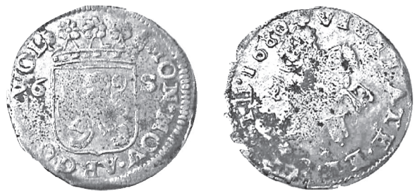
Ruiterschelling Zwolle 1680

stuiver = 4 oorden oord = 2 duiten duit = 2 penningen