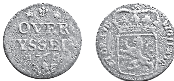
Overijsselse duit: OVERYSSEL 1760

Hieronder ziet U een afbeelding van een duit uit OVERYSSEL uit het jaar 1766. Deze duit werd onlangs gevonden aan de Dorpsstraat te Nibbixwoud en anoniem geschonken aan 'De Cromme Leeck'. <<