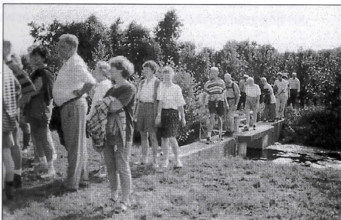
Het passeren van een stuw