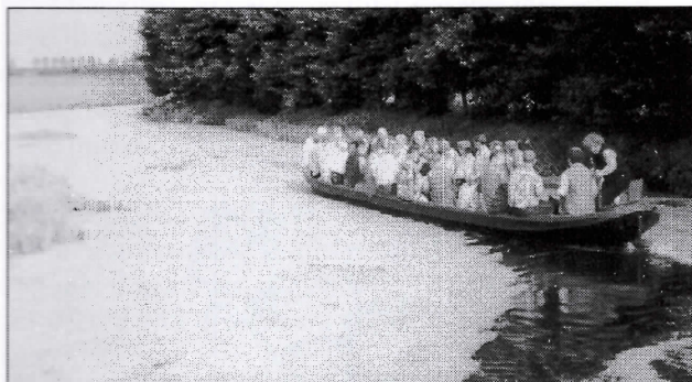
Varen door het kroos op de Cromme Leek

naar het beginpunt teruggebracht. Mede dankzij het fraaie weer en de enthousiaste uitleg wordt deze middag een succes.